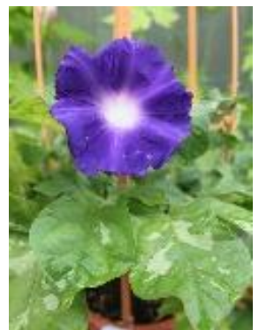
写真：夏の顔・朝顔

かくいう小欄の持つミトコンドリアの遺伝子はA型。この遺伝子型は、母方のはるかな祖先が、バイカル湖の周辺でマンモスを追うハンターであったことを推測させるもの。すなわちピマインディアンとは祖先が同じであること意味する。 \beta 3 受容体は調べてはいないが、ちょっと油断をすると、すぐに太るタイプであることは間違いない。雨上がりの朝にはジョキングを心がけ、晩酌のつまみには気をつけなければと思っている。