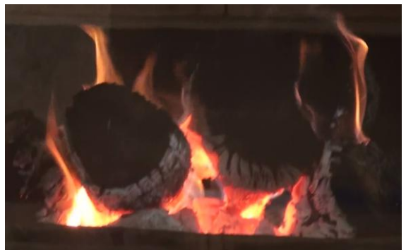
写真： 聖なる焰 ソロアスター寺院（ヤズド）

熾（お）きては、爆（は）ぜ跳ぶ火の粉。ガタと崩れて白く尉（じょう）となる櫓（ほた）。そこには、心を和ませるぬくもりと陰影が漂っている。ヤズドの寺院の聖なる焰は、大きな存在感に包まれながら揺らめいていた。