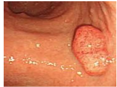
過形成性ポリープ

腺腫は、高齢者で腸上皮化成をもつ、かなり萎縮した粘膜にみられます。男性に多く男女比は4：1です。高齢者の萎縮性粘膜にみられ、形はドーム型、平たいもの、花壇状など様々です。灰白色で整った凹凸があります。