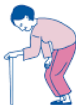
背中や腰が曲がる