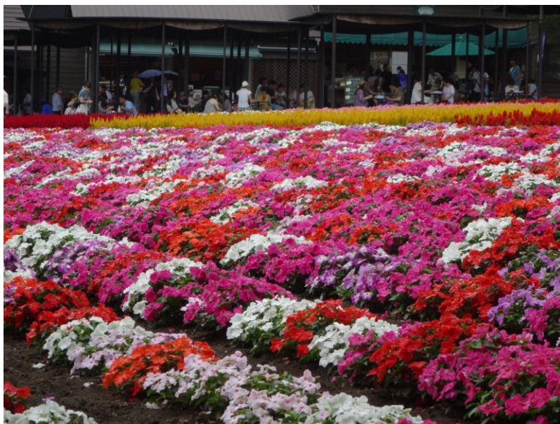
北海道 富田ファーム