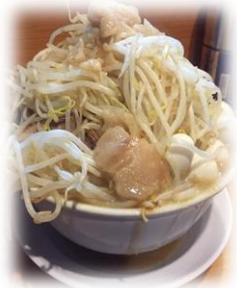
八王子野猿街道店

二郎はコスバが素晴らしいです。600円から700円台で普通のラーメン屋の3倍の量が食べられます。しかもそこに無料トッピングを増すことができます。無料トッピングは、にんにく、野菜、アブラ、カラメの4種類です。さらにマシマシというのでもできます。店員さんから「ニンニクは？」と聞かれるので「野菜マシマシニンニクアブラカラメ」といった具合に呪文を唱えるように答えたらよいのです。いきなり聞かれるので、噛まないように心の中で復唱しながら、緊張してその瞬間を待ちます。それも楽しみの一つです。